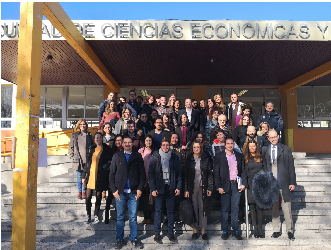
Asistentes Seminario de Docencia Online 2018