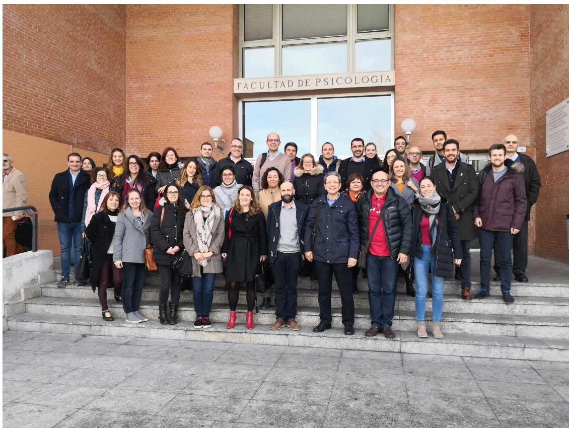
Asistentes Seminario de Investigación Experimentación en Marketing 2018.